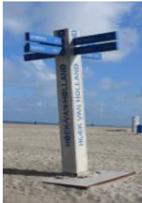
Ort: Hoek van Holland